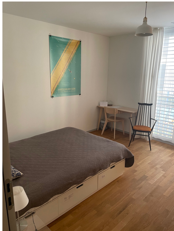
Bilder: Blick ins Gästezimmer: Schlafsofa (links), Bett (rechts)